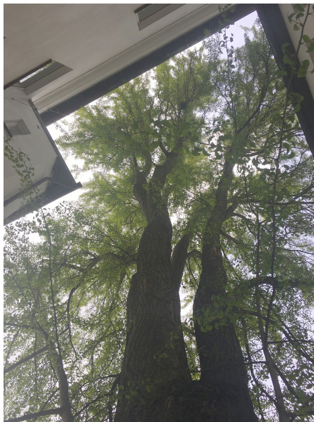
Illustration 1: Vzdálenost koruny od okolních budov