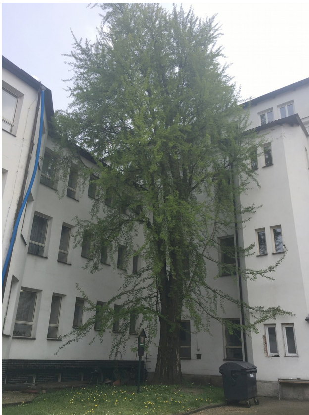
Illustration 2: Celkový pohled na hodnoceného jedince