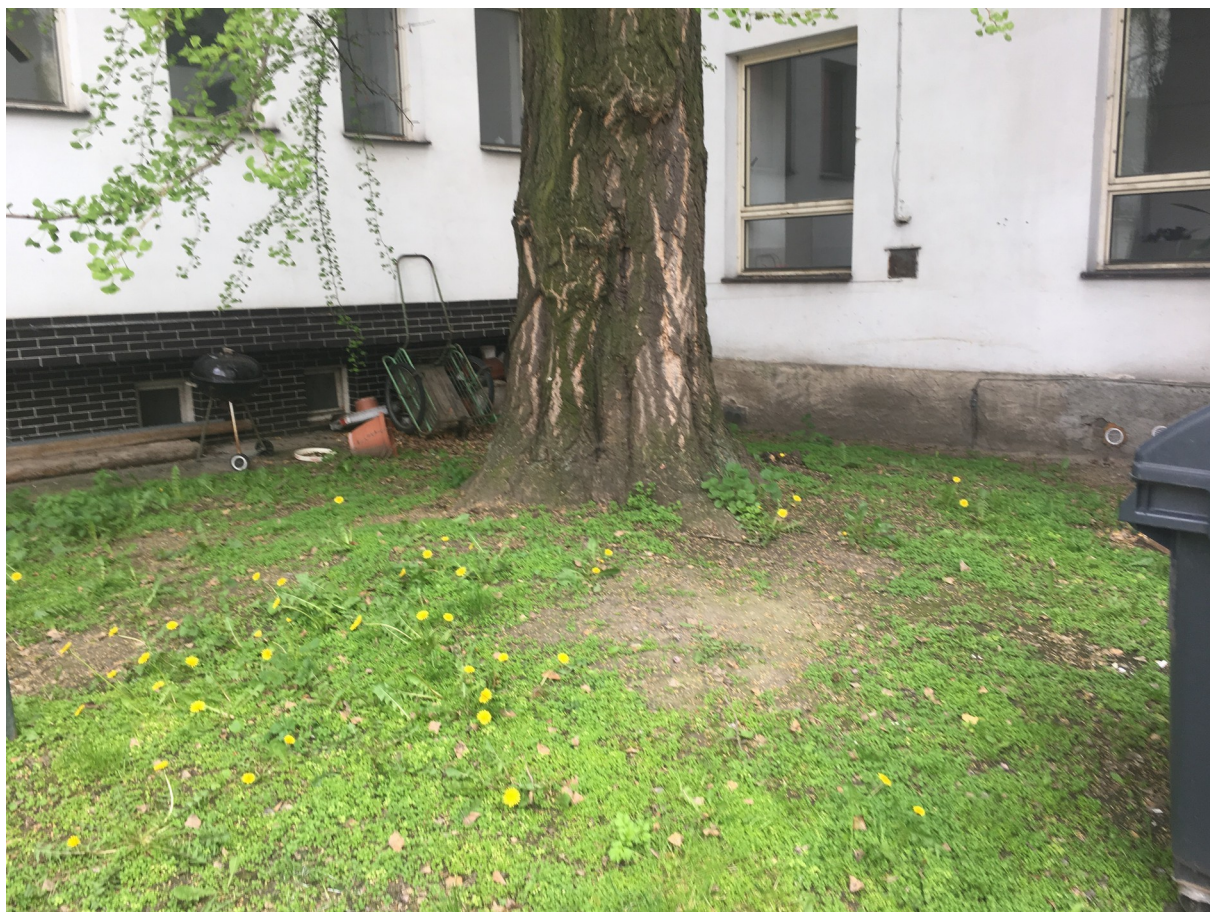
Illustration 3: Stanovištní poměry stromu