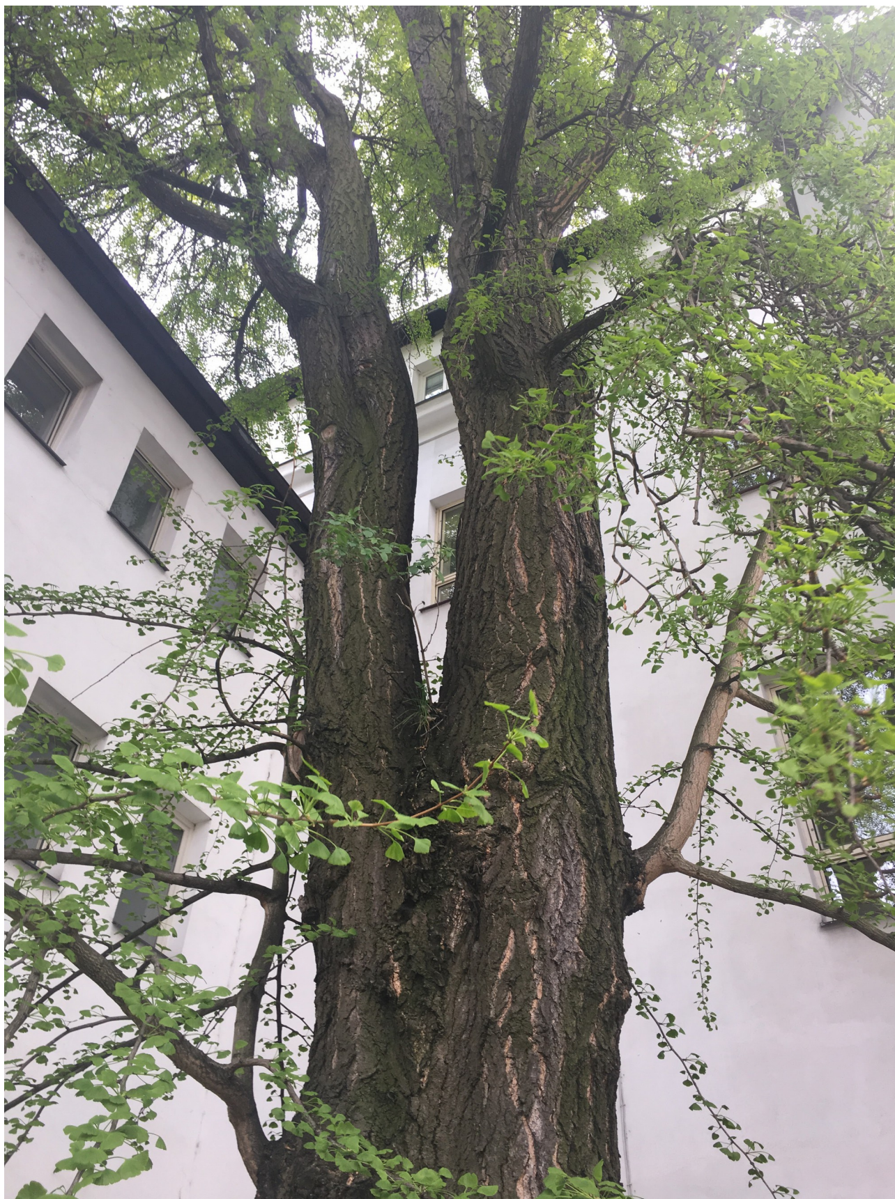
Illustration 4: Detail kosterního větvení stromu